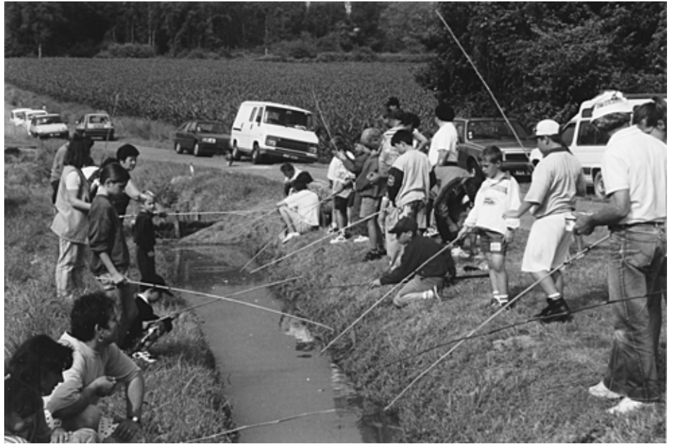
Grande affluence de concurrents pour le concours de pêche des fêtes, dans l'arriu de Yoy qui, pour cette occasion exceptionnelle, s'est fait le plus large possible.

Le concours de pétanque occupa l'après-midi. Sur un revêtement peu propice aux exploits les équipes s'affrontèrent autant acharnées que pour un championnat de France. Sous un soleil de plomb les boules avaient souvent tendan-