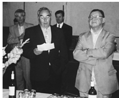
Discours prononcé par le maire lors de la réception organisée pour le départ de M. le curé Olhagaray, le samedi 25 août.

ALAIN LABORDE BAUZET & JEAN-MARC LAGOUARDE